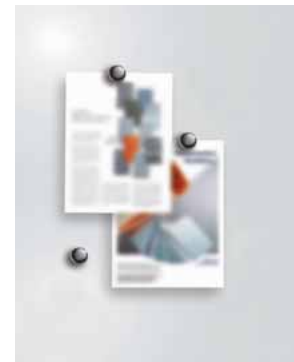
Magnethaftend und beschreibbar mit Marker, grau Code: HP 8208