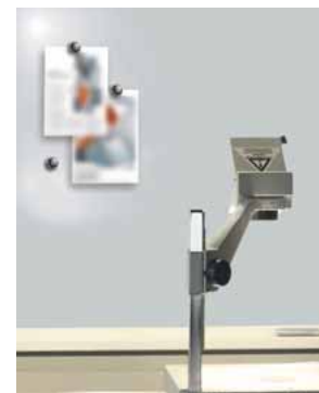
Projektionsoberfläche magnethaftend, grau Code: HP 8219