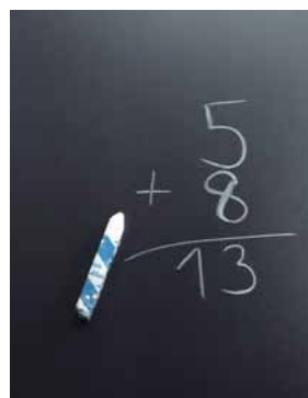
Magnethaftend und beschreibbar mit Kreide, schwarz Code: HP 8205