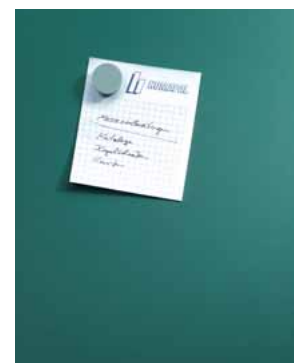
Magnethaftend und beschreibbar mit Kreide, grün Code: HP 8211