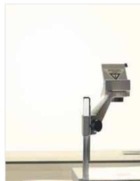
Projektionsoberfläche magnethaftend, weiß Code: HP 8217