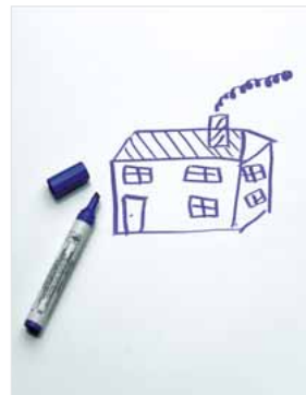
Magnethaftend und beschreibbar mit Marker, weiß Code: HP 8206