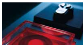
Sicherungstechnik/Zeit- und Zutrittskontrolle (STA)